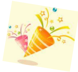
田中 芳子 さま